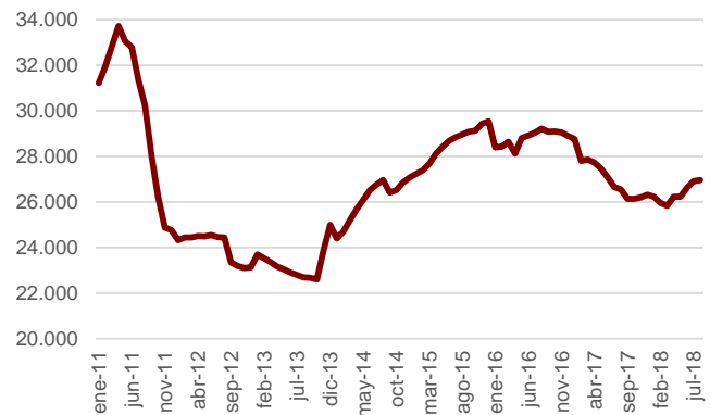
Evolució històrica dels expedients vigents RMI i RGC

Cites prèvies: s'han atès el 99% de les persones que han demanat la prestació